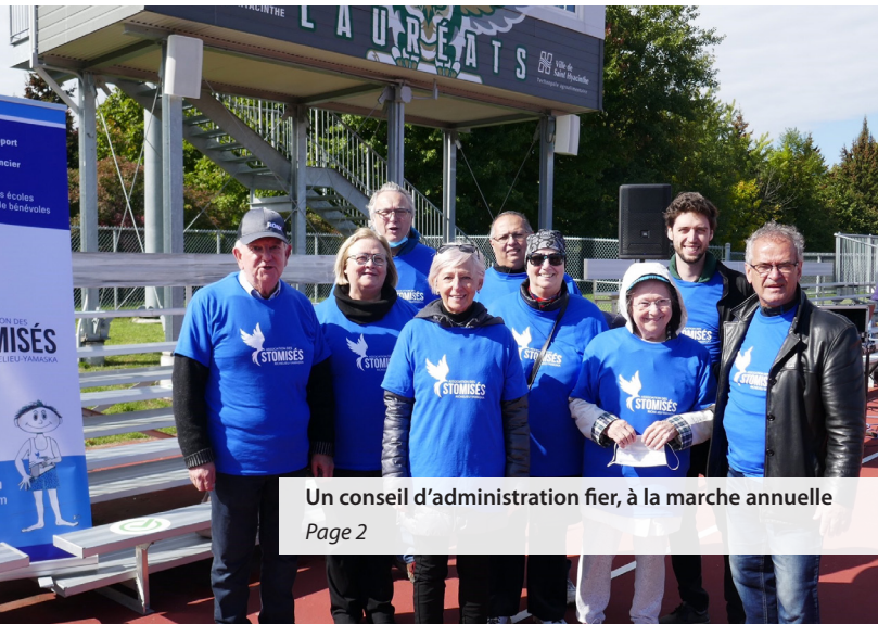
Un conseil d'administration fier, à la marche annuelle Page 2