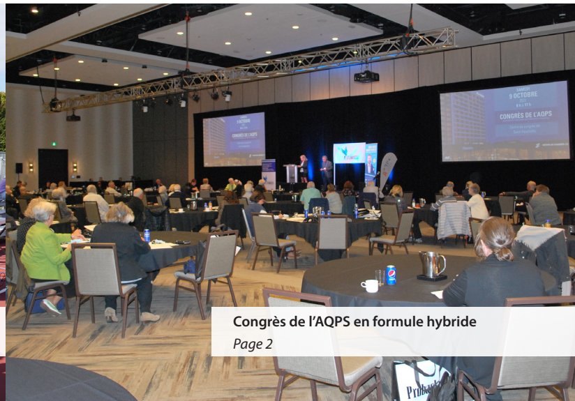
Congrès de l'AQPS en formule hybride Page 2